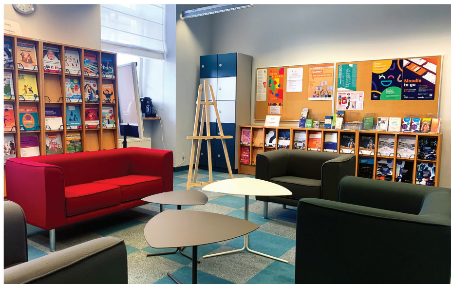
F.use -Pädagogisches Dokumentationszentrum

Des Weiteren verfügt das IFEN über zwei innovative Lernorte F.USE und ein pädagogisches Dokumentationszentrum, dessen Bestand eine Referenz in Luxemburg ist.